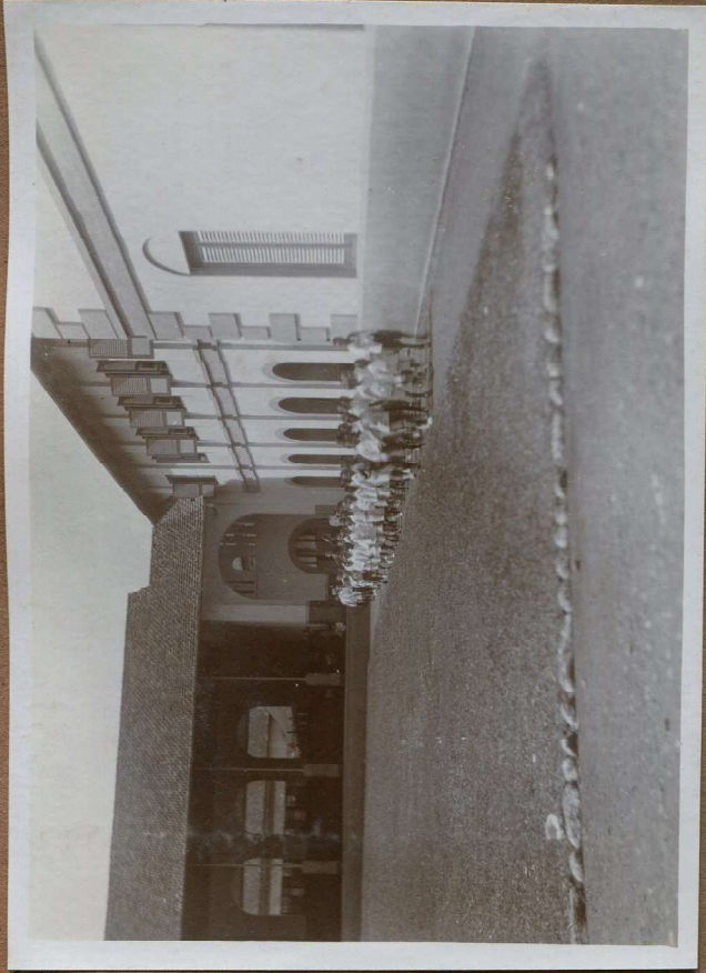
De Hoof tuit met de wandeling.