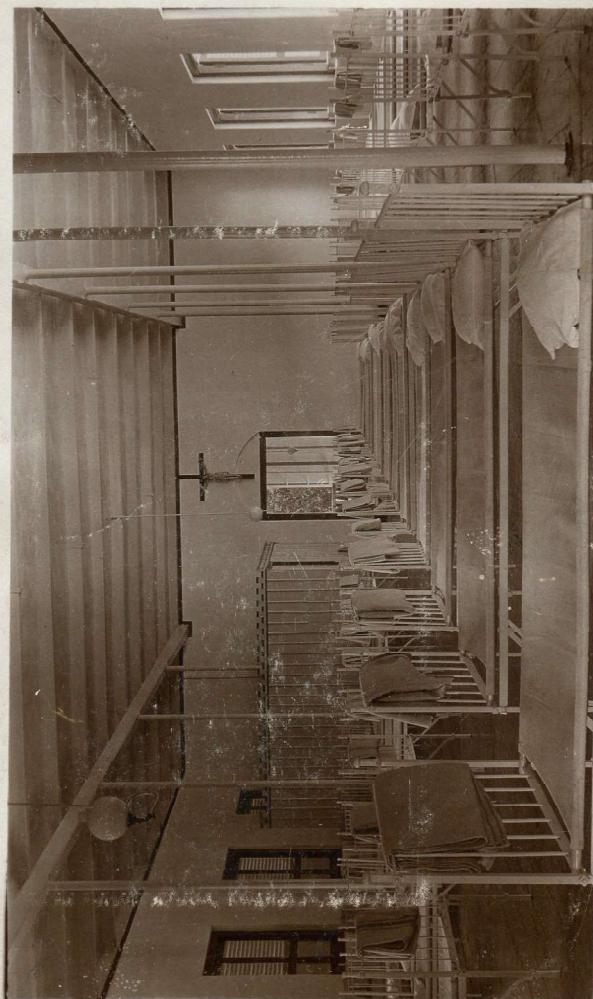
Een der slaapkamers.