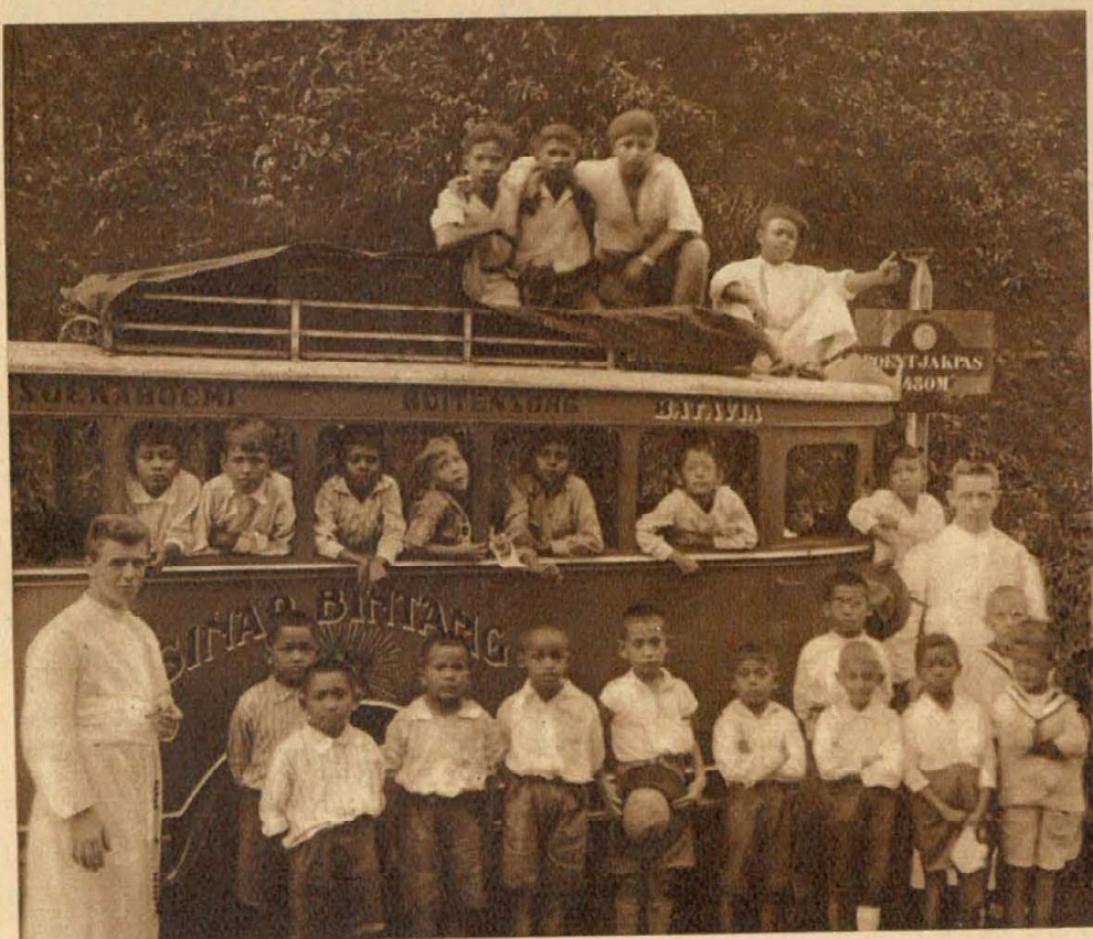
Leerlingen van het St. Vincentiusgesticht te Buitenzorg: Een dagje uit

Broeders van O. L. Vrouw van Lourdes (Dongen), in de Java-missie der Paters Jezuïeten.