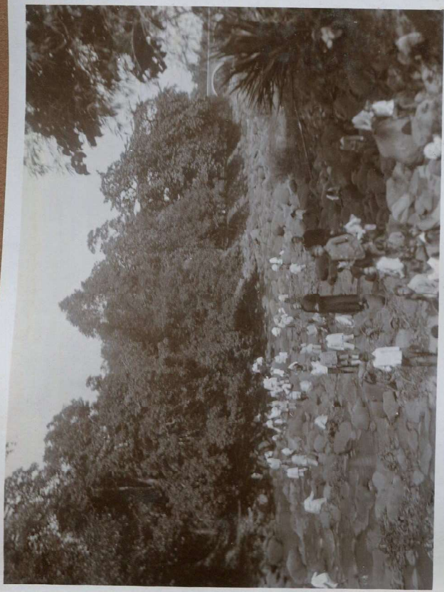
De Boel beuitt n.l. de boel of rivier.