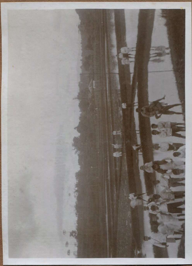
Bij 4 voetbalteam de laatste of nacht opspel.