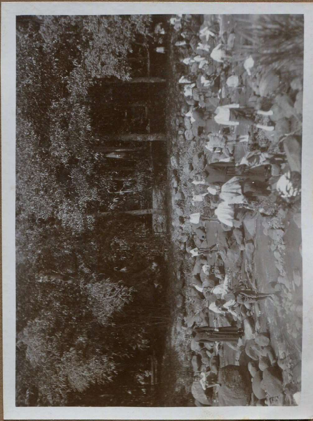
Hier zijn de leerlingen in hun element. Hoeken is 't water - Gaanwaden Op den achtergrond de plantentuin.