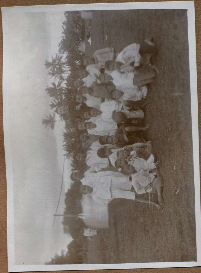
Op 4 voetbalteam.