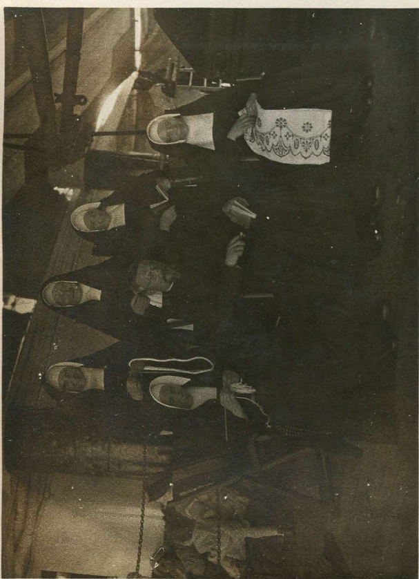
De zusters van de Doort naar Sumatra in vesting.