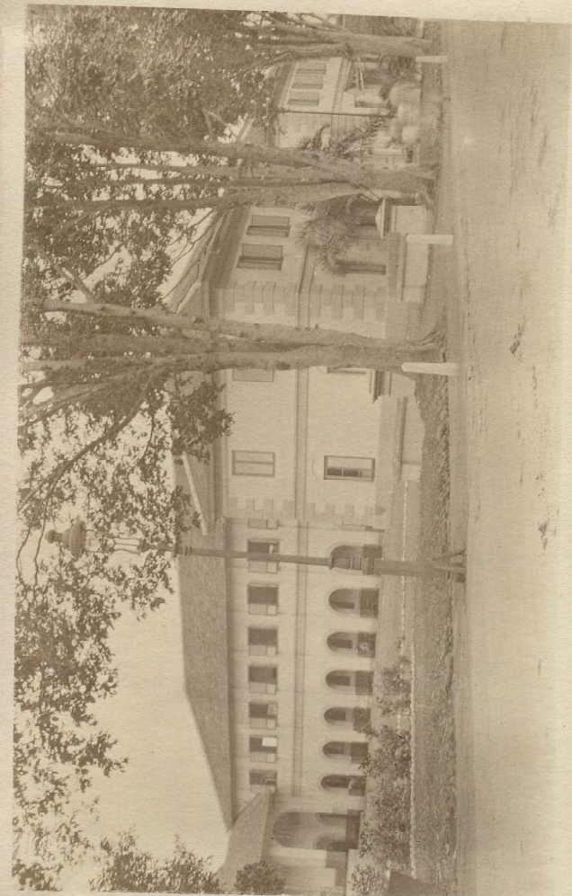
De Vincentius geschied van vrom gesien.