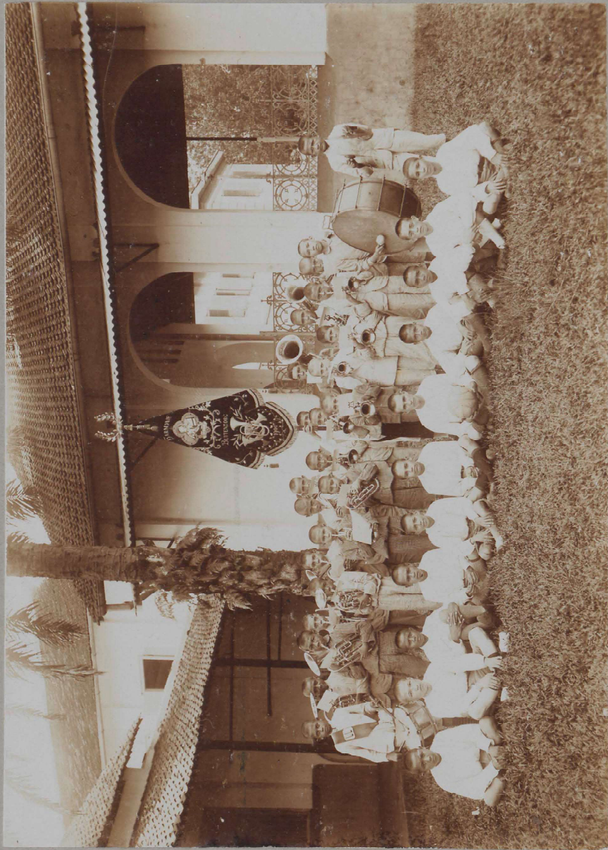
Harmonie en footballclub.