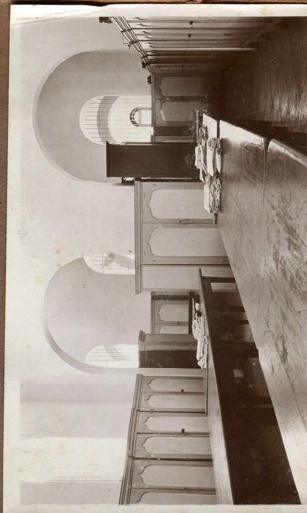
'n dekje 't linnenkamer.